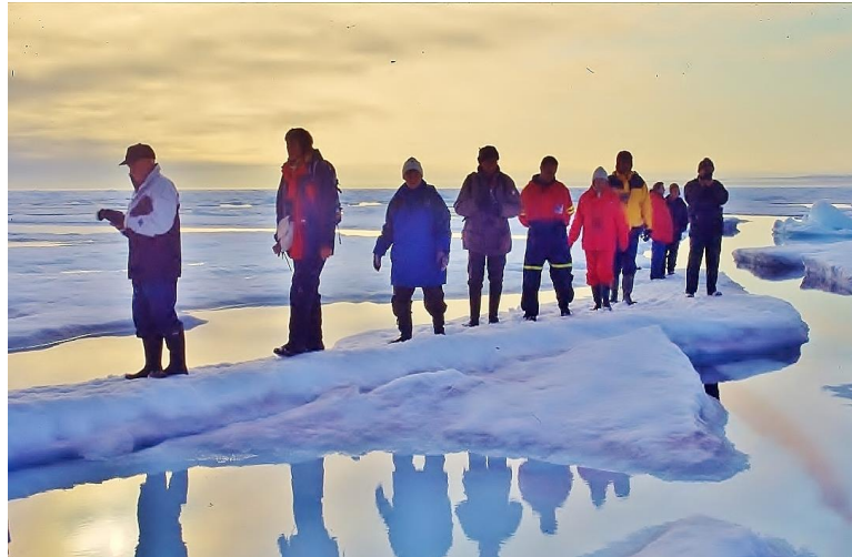
På den fasta isen framför glaciärfronten på en nattlig vandring, Svalbard.