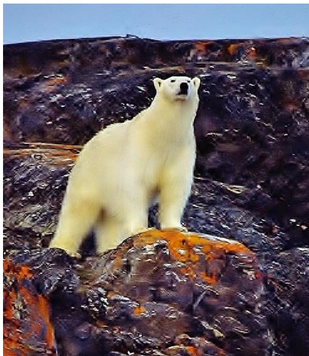
Isbjörn på nära håll i Liefdefjorden, Svalbard.