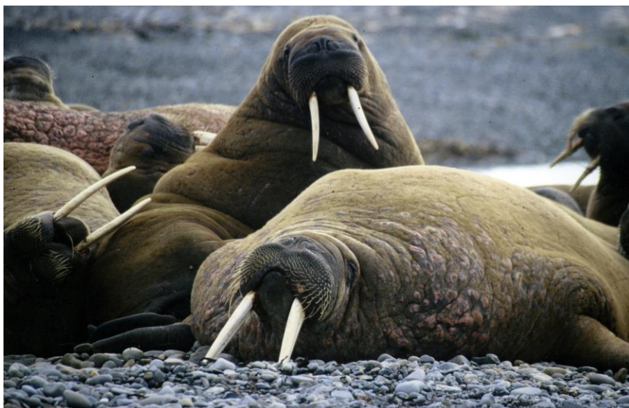
Valrossar, Svalbard.

Avsluta varje sammankomst med att ställa frågorna: Är det något du har funderat över som vi inte har talat om eller tagit upp till diskussion? Är det något du skulle vilja veta mer om?