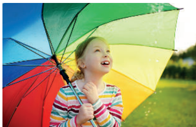
Allsång med barnkörer och andra inslag från kulturskolorna i Eda och Eidskog